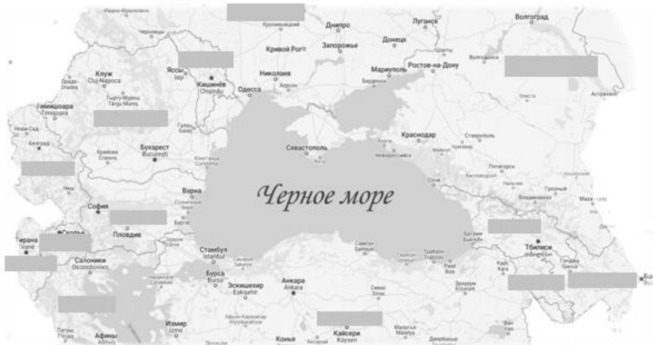
Рисунок 1 – Карта: Черноморский регион и страны-участницы ОЧЭС

Задание 2. Укажите верное расположение стран-участниц ОЧЭС на карте (рисунок 1).