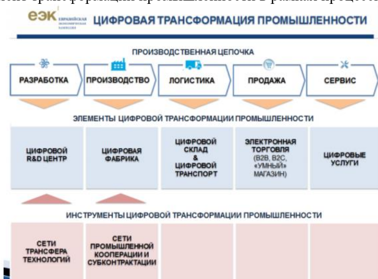
Рисунок 1 – Процессный подход

- определить место компании в производственной цепочке, уточнить возможный элемент и инструмент трансформации промышленности в рамках процессного подхода (рисунок 1);