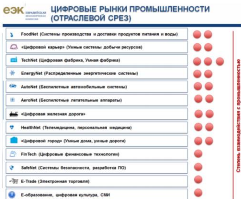
Рисунок 2 – Отраслевой подход 3

- определить отраслевой срез в рамках отраслевого подхода (рисунок 2) ;